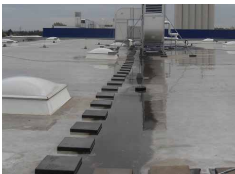
Vonalra lejt a tető, nincs korrekció