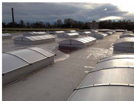
A tervnél nagyobb kupolák belemetszenek a lejtésbe