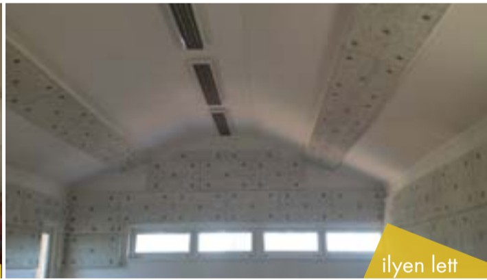
A fent részletezett, súlyos problémák kezelésére a Tektalan O37/2 termékünk alkalmasnak bizonyult.

A 75mm vastagságú kőzetgyapot maggal ellátott fagyapot rendkívül jó hangelnyelési értékekkel rendelkezik, így tökéletes volt erre a felhasználásra. A táblákat műanyag TERMOFIX CF 8/115-ös beütőszeges dübellel rögzítettük a falakon, valamint a mennyezeten. Az élképességgel készült fagyapot termék fehér színű gyári festést kapott, ami igazán esztétikussá és egyedivé változtatta a foglalkoztató terem hangulatát.