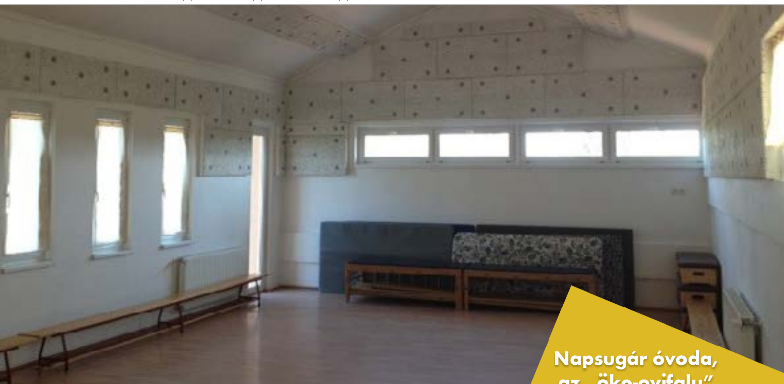
Napsugár óvoda, az „öko-ovifalu”